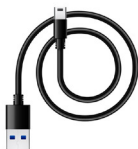
Cable carga USB-C