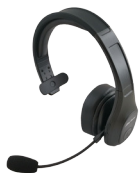
Microcascos Bluetooth Q9